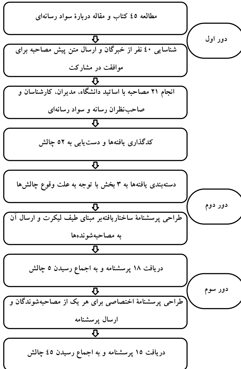
شکل ۲- فرآیند پژوهش در یک نگاه

پس از اتمام دور اول با هدف اکتشاف چالش‌های افزایش سواد رسانه‌ای مخاطبان برای سازمان صداوسیما از طریق مصاحبه عمیق، دور دوم و سوم با هدف اجماع بر سر یافته‌های دور