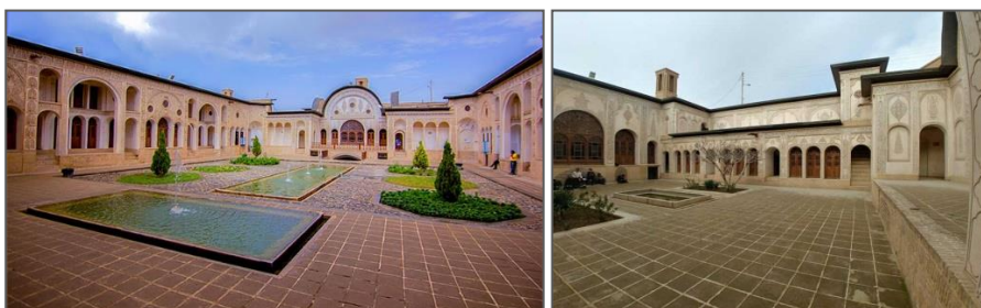
شکل ۱. خانه درون‌گرای ایرانی و اتاق‌هایی که همه رو به حیاط دارند؛ تصویر راست حیاط بیرونی و تصویر چپ حیاط اندرونی و در پایین پلان‌ها و تصویر سه‌بعدی خانه (خانه طباطبایی‌ها در کاشان)