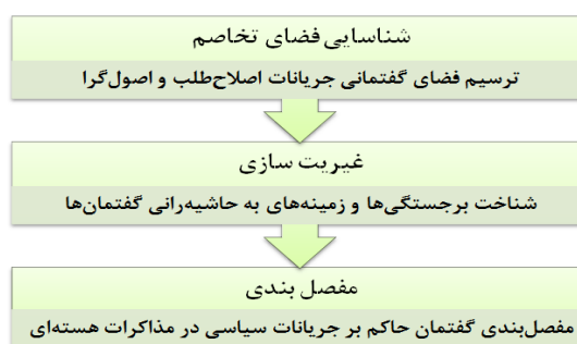
شکل ۲: مراحل تحلیل گفتمان لاکلاو و موف

در روش تحلیل گفتمانی لاکلاو و موف، گفتمان‌های مسلط دارای یک دال مرکزی بوده و دال‌ها و نشانه‌ها در شاکله‌ای به نام مفصل‌بندی، واجد ساختار و هویت شده‌اند. در این شرایط، رابطه از پیش تعیین‌شده و مشخص میان دال‌ها و مدلول‌ها وجود ندارد و دال‌ها یا نشانه‌ها دارای خصلتی شناور و سیال هستند؛ بر این اساس، مراحل تحلیل گفتمان به روش لاکلاو و موف را می‌توان بدین شکل ترسیم نمود: